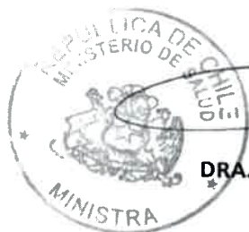
DRA. XIMENA AGUILERA SANHUEZA MINISTRA DE SALUD

Por orden del Presidente de la República